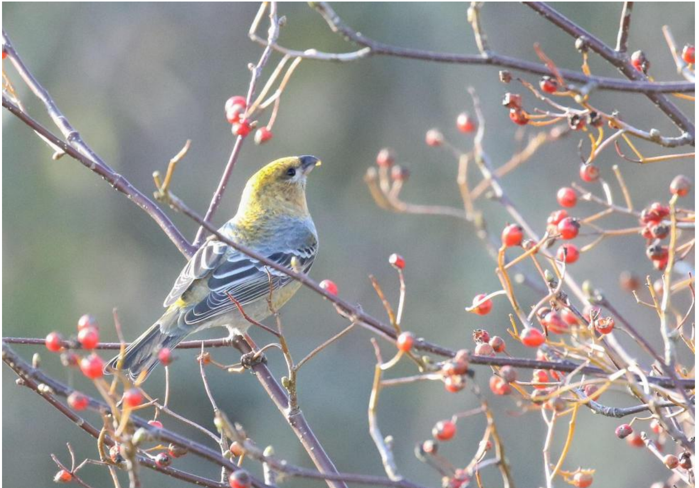
Krog­næb, hunfarvet, Skagen den 27. oktober 2019.

Imidlertid skete ankomsten i søndags den 27. oktober. Gilleleje meldte om to vesttrækkende fugle klokken 11.20. Skagen fulgte snart efter. Først med to rastende fugle klokken 12.00 og senere med yderligere 4 fugle der rastede i omkring 5 minutter fra klokken 12.54.