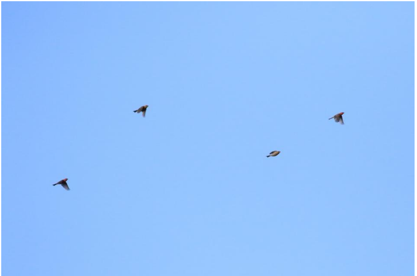
Fire krog­næb på trækforsøg. Bemærk den kraftige bygning, lang hale samt at der er tale om to hanner og to hunfarvede. Grenen den 28. oktober 2019.

Senere tjekkede vi Skagen Kirkegård og andre bærbuske i Skagen, inden turen gik hjemad. Vi var meget glade. Vi havde fået en af de der meget fantastiske dage i felten. En af de dage man altid vil huske. Spækhuggere, krog­næb, hvidnæbbet lom, alle tre korsnæb, tristis gransanger, store tornskader, bjerglærker osv. Skagen leverede igen!