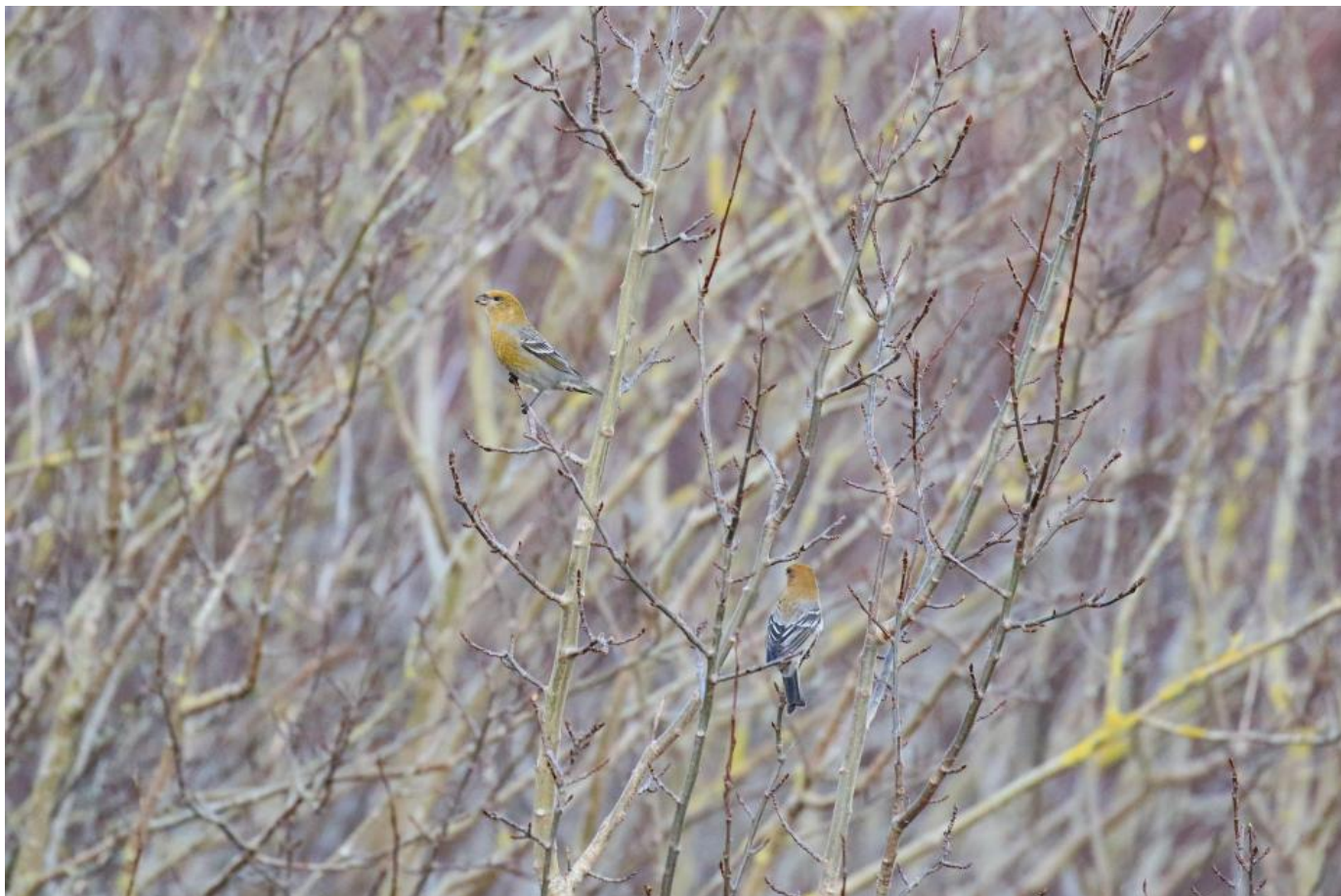
Krognæb, hunfarvede, Skagen den 27. oktober 2019.

Vejrudsigten for mandag så fortsat lovende ud. Klart og køligt og ret svage vindforhold fra nordøst. Det lugtede af finketræk og yderligere ankomster af krogneb til Skagen.